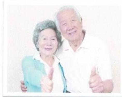
สร้างสุข