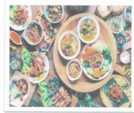
สร้างเศรษฐกิจ